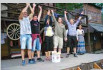
Vítězný modrý tým

O víkend 11. – 12. 06. 2016 se zaměstnanci STAVMATU v České republice na chvíli ocitli na „divokém západě“. V tuto sobotu a neděli měli Stavmaťáci možnost vyzkoušet rýžovat zlato, střílet z luku s indiány, házet noži a sekerou s kovboji, nebo vyzkoušet jak se točí lasem, anebo navštívit bar u hrobníka. Všechny tyto aktivity se odehrávaly v atraktivním prostředí westernového městečka Šiklův mlýn nedaleko Bystřice nad Perštejnem.