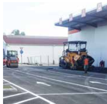
Stavebné práce v Budapešti v plnom prúde

a spomínaného Proficentra, a vytvorenie úplne nového systému obsluhovania na spoločnej platforme. Práce sa začali v máji 2016, termín dokončenia prestavby je plánovaný počas septembra 2016. Projekt nového Proficentra už nesie na fasáde nový znak spoločnosti ST, ktorý sa zavádza vo všetkých troch krajinách. Spomínaná prestavba si vyžiadala a aj si v súčasnosti žiada maximálnu podporu a spoluprácu všetkých