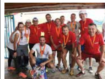
Bežecký tím STAVMAT

Šestdesiat nadšencov behu prebehlo počas prvého júňového víkendu Slovenskom z Košíc do Bratislavy. Bežci prvého najdlhšieho štafetového